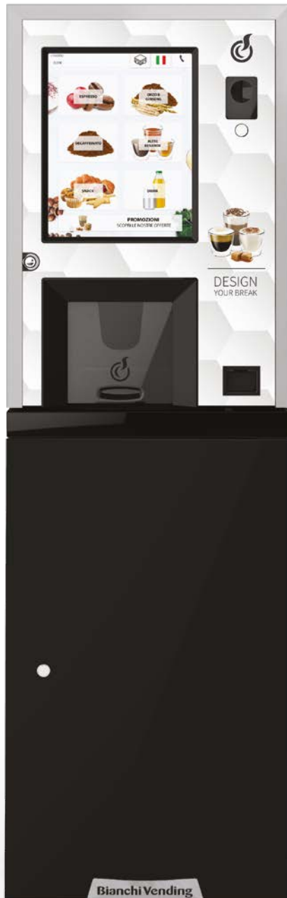
LEI250 TOUCH15" + MUEBLE + KIT ADHESIVO CON GRÁFICO "DESIGN YOUR BREAK" (OPCIONAL)